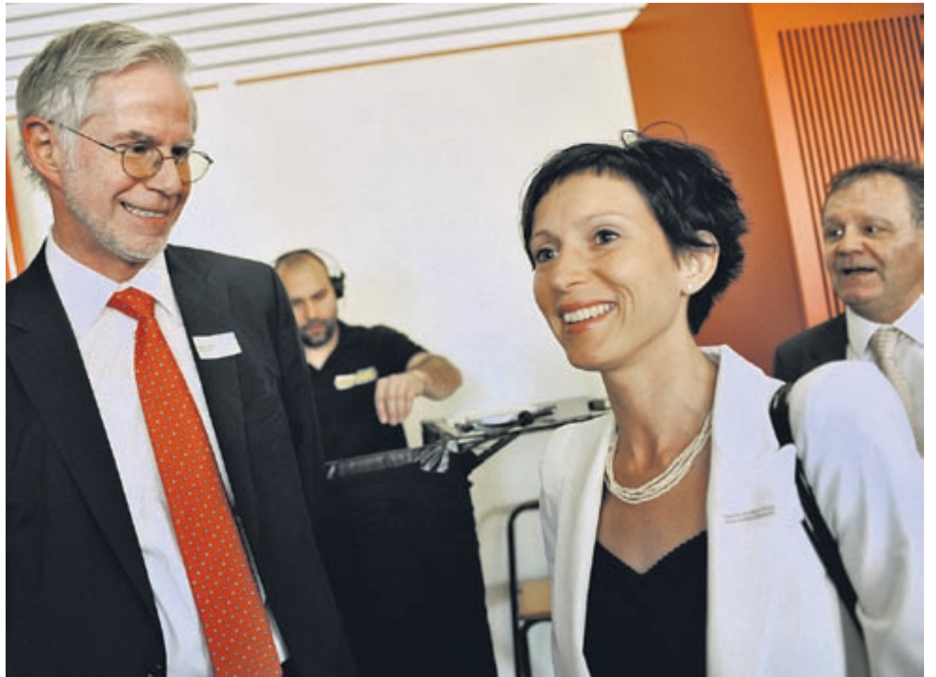
Im Idealfall eröffnen die Studenten von ZHAW-Rektor Werner Inderbitzin in dem Ergänzungsbau des Technoparks, der gestern mit einer Ansprache von Nationalratspräsidentin Pascale Bruderer eröffnet wurde, neue Firmen.

Von dieser Einstimmigkeit schien auch Nationalratspräsidentin Pascale Bruderer (SP) beeindruckt zu sein. Es werde ihr in Erinnerung bleiben, dass in Winterthur alle am gleichen Strick ziehen, wenn es darauf ankomme, sagte sie zum Schluss ihrer Anspra-